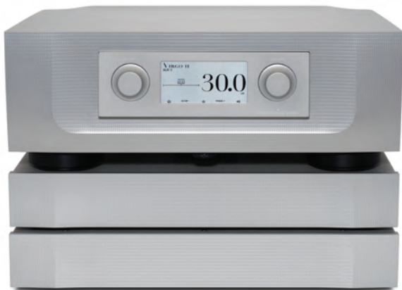
Stereo Preamplifier VIRGO II /VIRGO III + D.C. Filter