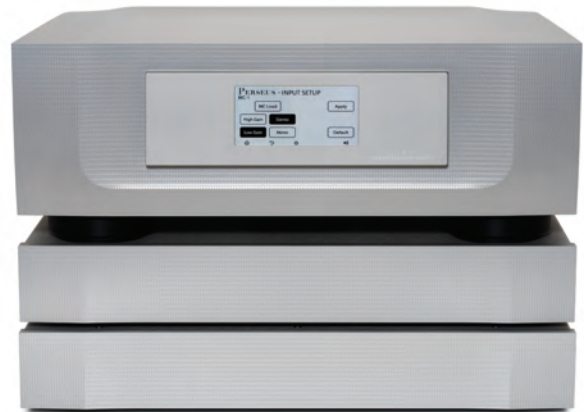
MC/MM Stereo Phono amp PERSEUS + D.C. Filter